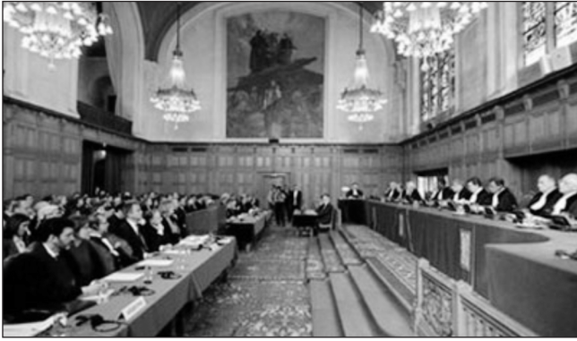
Tribunal de la Haya

A Europa, des de l'any 1.900, 12 estats han aconseguit la independència, alguns d'ells exercint el dret a decidir, reconegut pels estats dels que procedien, altres pels dictàmens favorables del Tribunal Internacional de Justícia, més conegut com Tribunal de la Haya.